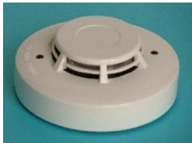
Analóg címezhető optikai füstérzékelő