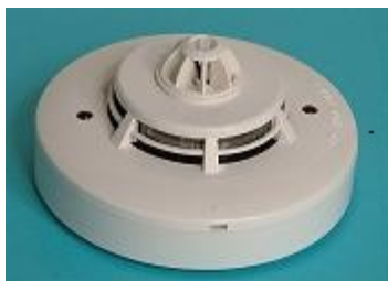
Kombinált füst és hőérzékelő